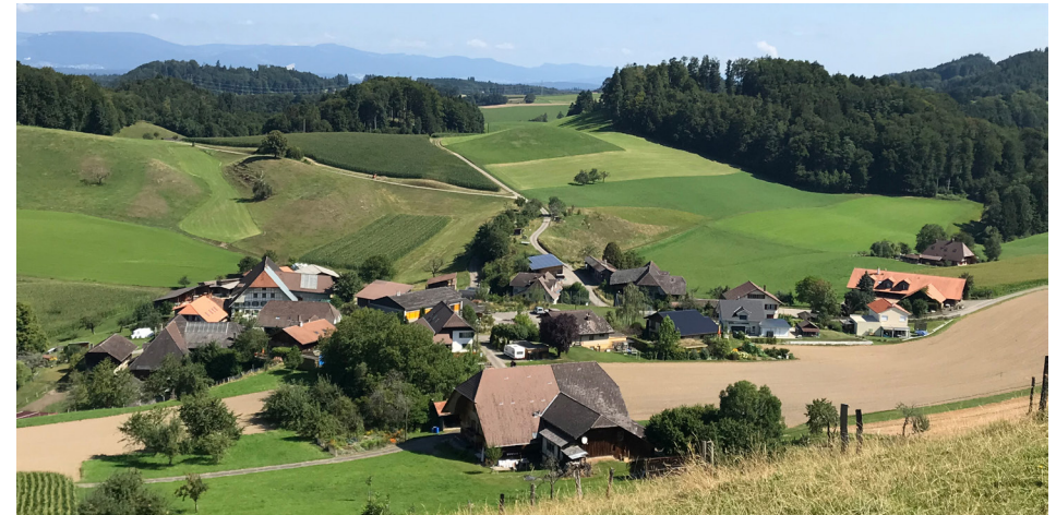
Aussicht von der Hohrütti auf Rüedisbach

der Buchgasse zurück nach Rüedisbach. Noch einmal schauen wir rechts zur Hohrütti mit dem steilen Hang, der früher mit Seilwinde und Schnecke (grosser Holzschlitten) bewirtschaftet wurde. Bevor wir wieder zum Schlüssel gelangen, treffen wir noch auf das ehemalige Schulhaus.