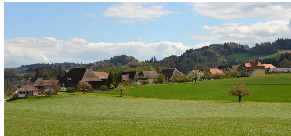
Ansicht Dörfli Breitenegg von Westen, 2023

seit 1924 Kapelle der Evangelisch-Methodistischen Kirche EMK des Bezirks Burgdorf-Breitenegg (Probelokal Posaunenchor Rüedisbach)