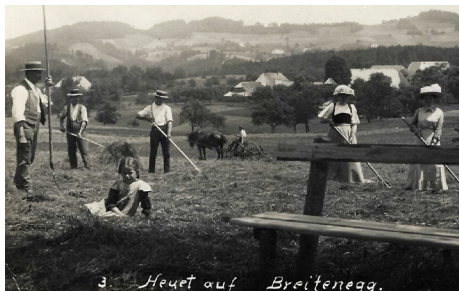
Heuet auf Breitenegg: Postkarte um 1910

ist sowohl im Bundesinventar der schützenswerten Ortsbilder der Schweiz als auch im Inventar der Denkmalpflege des Kantons Bern als geschützte Baugruppe aufgeführt.