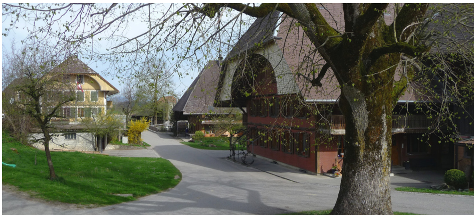
Breitenegg: Denkmalpflege des Kantons Bern, Jürg Hünerwadel, 2016