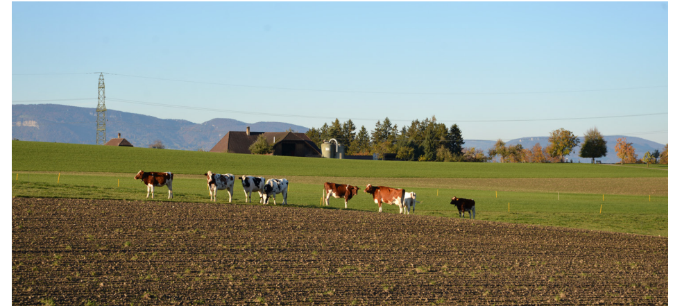
Deckacker hinter der Egg

und weiter hinunter zum Unteren Kasten, wo wir die Kantonsstrasse überqueren. Es ist nur noch ein kurzer Weg bis zum ehemaligen Bahnhof Riedtwil und zur Landi mit dem Kafi Mutzbach, offen an 365 Tagen.