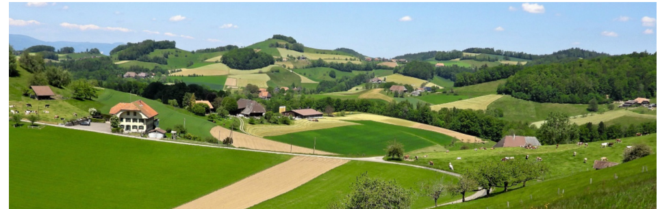
Aus dem Fotobuch «Wynigenberge» von Hans Schuler, 2021