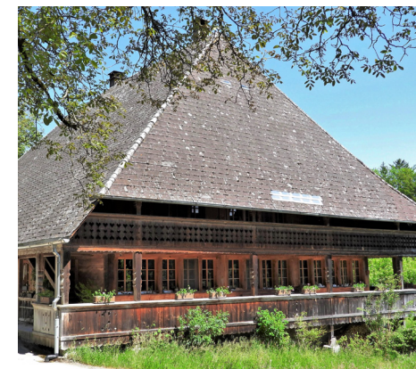
Hof Alchenberg

ren das Bauernhaus auf 1553 . Die giebelständigen Lauben stammen von ca. 1700 und der Ökonomieteil wurde 1944 neu gebaut. Der Steinstock – vermutlich aus der Mitte des 16. Jh. – neben dem Bauernhaus wurde 2021 restauriert. Der qualitätsvolle Bohlenständerbau über dem massiven Sockel, dem teilweise in die Molasse eingetieften Kellergeschoss und den spätgotischen Kuppelfenstern im Erdgeschoss gilt als seltene Beispiel dieses Haustyps . Zwischen den beiden Höfen im Alchenberg steht der Doppelspeicher mit Ofenhaus von 1737 . Die Denkmalpflege spricht von einem Unikat , weil der