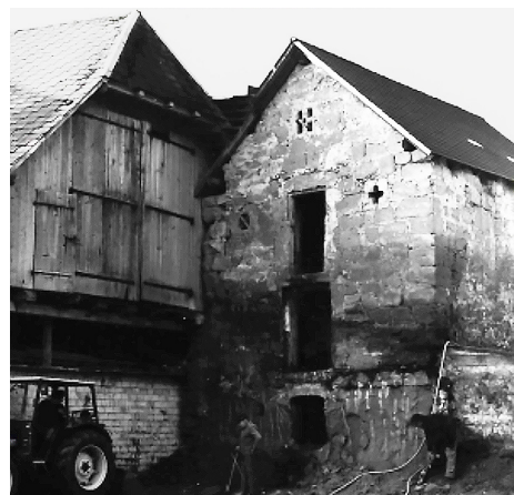
Kapelle Oberbühl: Neubau des Brückstocks 1986

Wie die Kirche im Dorf ist mit der Kapelle von Oberbühl in den Wynigenbergen ebenfalls ein Sakralbau das älteste Gebäude. Als «besonders geheiligte Kapelle St. Ulrich» ist sie bereits 1447 erwähnt. In der Reformation wurde sie um 1530 zu einem Kornspeicher umfunktioniert. Weil man lange die Herkunft dieses Gebäudes nicht deuten konnte, wurde die Kapelle als Heidenstock bezeichnet.