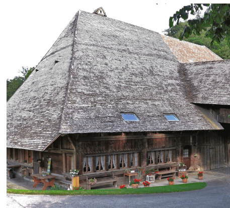
«Glungge» in Brechershäusern

In Brechershäusern steht mit der nach den Gotthelf-Filmen genannten « Glungge » (1681) eines der ältesten Bauernhäuser des Kantons. Nicht weniger beeindruckend ist das benachbarte sogenannte Kellerhaus von 1755 , das in seiner Multifunktionalität Ofenhaus, Waschhaus, Speicher und Wohnstock