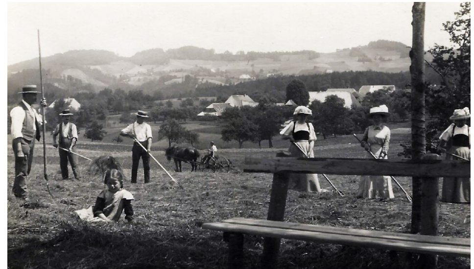
Heuet auf Breitenegg: Postkarte um 1910

Jezen ärne halt d'Maschine ds Gwächs, sogar ir Nacht! Aber niene isch e Schnitter, won es Gpässli macht.