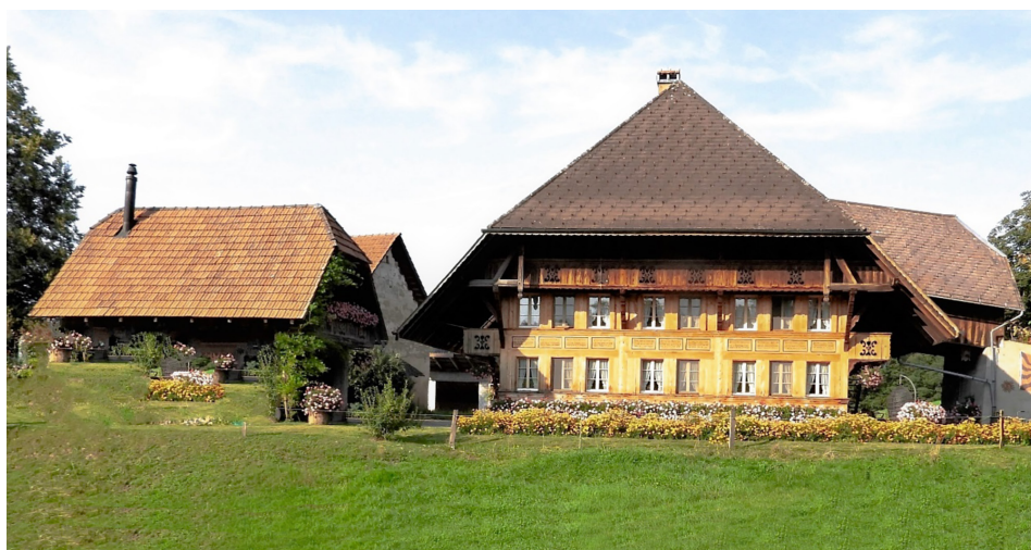
Hof Oppliger, Tal

Speisewirtschaft Wilder Mann Ferrenberg von 1838: Der Wilde Mann Ferrenberg ist ein typisches Beispiel für die Gastwirtschaften im Emmental abseits der Dörfer, wie sie in den 1830er-Jahren mit der Liberalisierung zahlreich entstanden sind. Wie auch andernorts