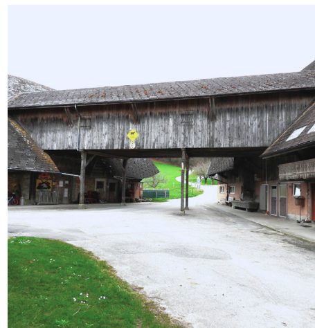
Einfahrtbrücke in Ferrenberg

waren sie als Speisewirtschaft mit Bauernhaus kombiniert. Im Falle der Speisewirtschaft Ferrenberg wurde der Ökonomieteil erst später angebaut. Bis vor kurzem wurde noch das Spezerei-Lädeli gegenüber der Gaststube geführt. Die Gaststube ist original mit Riemenboden, rauen Tischblättern, Sitzofen und aufklappbarer Teilwand zum Säli erhalten, und beim Einkehren fühlen wir uns an Gotthelfs Zeiten erinnert. Im Dachgeschoss befindet sich ein Saal, der wesentlich zum kulturellen