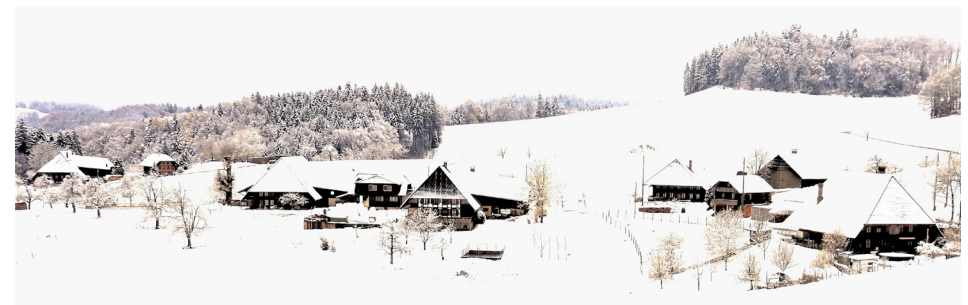
Hochtannen im Winter mit Vitshuus links

Emmentals . Erst unterhalb von Wynigen in Richtung Riedtwil beginnt der Oberaargau, zu dem auch die «sanfteren» Buchsberge im Norden gehören. Die grosse Gemeinde Wynigen , zu der die Wynigenberge gehören, ist Teil des Verwaltungskreises Emmental . Die Gemeinde umfasst 2820 ha Fläche und zählt 2131 Einwohner (Ende 2025). Nicht zuletzt bedingt durch die ausgedehnten Wynigenberge erstreckt sich das Gemeindestrassenetz über 87,6 km.