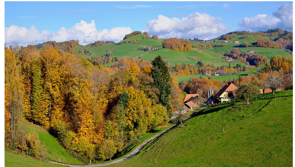
Wynigenberge mit Oberbühlchnubel: über den Sandacker und über den Kappelengraben

Die Höfe auf den Wynigenbergen sind seit dem Mittelalter aktenkundig: Riedern, Leggiswil, Brechershäusern, Breitenegg, Rüedisbach, Wil, Mösli, Hüseren, Ferrenberg, Friesenberg, Häckligen, Hochtannen, Kappelen, Fuhren, Alchenberg, Oberbühl und Bühl nördlich des Kappelengrabens ; Hirsbrunnen, Sollberg, Leumberg, Hoffholz, Mistelberg, Schwanden und Tal mit Wyniger-Kaltacker südlich des Kappelengrabens .