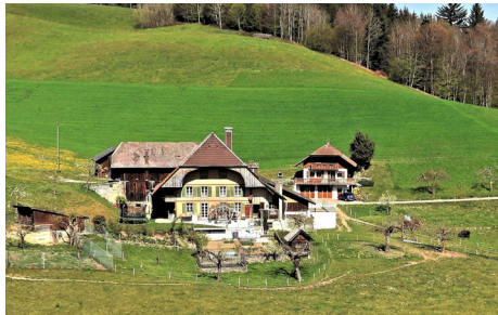
Märgeli mit Zufahrt von Hüseren