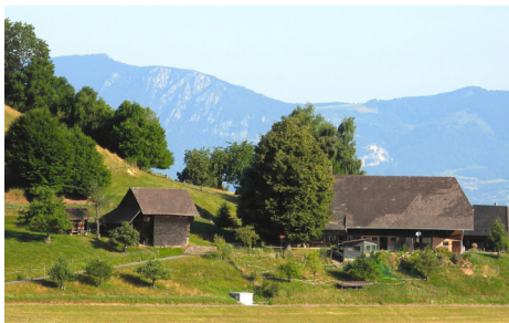
Hüseren (früher Oberhüseren) östlich des Oberbühlchnubels