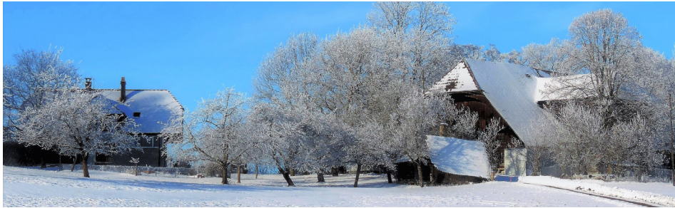
Gehöft Deuchel (Dünkel); Ofenhaus vor dem Bauernhaus verschwunden