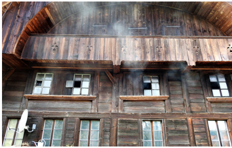
Räuchern im Bauernhaus Deuchel (Dünkel)