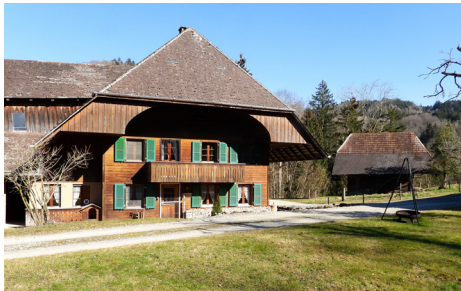
Hüserenäbnit oberhalb des Mutzbachgrabens