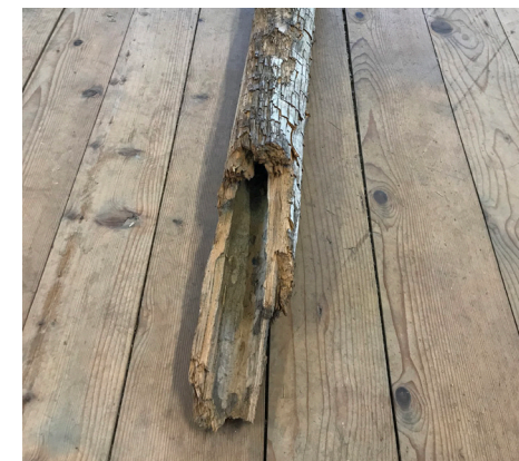
Mit langem Handbohrer ausgehöhlter Dünkel als Wasserleitung