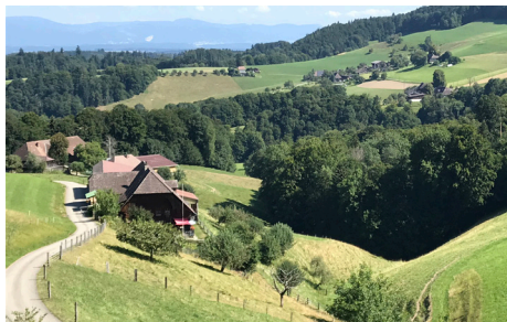
Untershüseren (früher Niederhüseren)