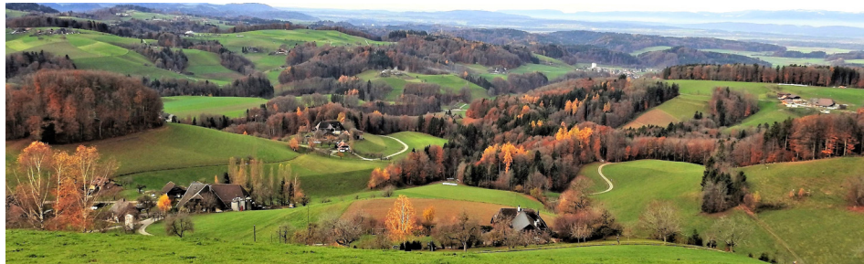
Aussicht vom Oberbühlchnubel in Richtung Dorf Wynigen