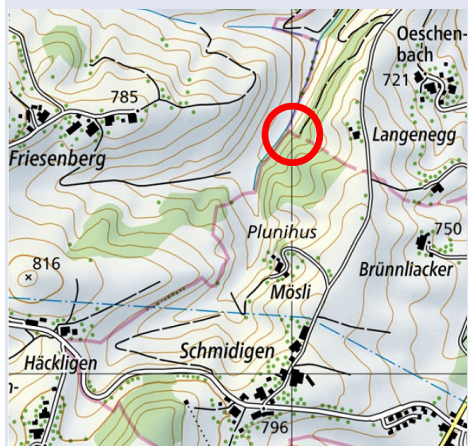
Standort Drei-Ämterstein 1787 und nach 1803