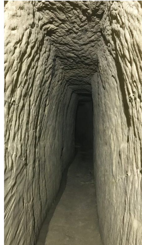
Mannshöhe ca. 50 m lange Wasserhöhle beim Lätthaus, Datierungen: 1791 und 1866