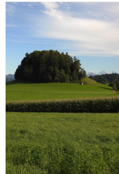
Burghügel Friesenberg von Norden

Noch im Herbst wurden die Mauern der Burg abgebrochen, um der Ritterschaft jegliche Gelüste nach einer Rückkehr auszutreiben. In der Staatrechnung von 1383 heisst es kurz und bündig: «... denne den Muren, als si friesenberg hinden nacha brachen 3 Pfund.» Die Steine fanden wohl Verwendung für Bauten der Bewohner in der Umgebung. Nach dem Volksmund sollen Blöcke für den Bau der Kirche von Walterswil gebraucht worden sein. Der Burgdorferkrieg mit dem Untergang zahlreicher Burgen markiert den Übergang zum Ancien Regime des Stadtstaates Bern. Im Gebiet Friesenberg erinnern noch zwei Ämtersteine an die Vermachung der Oberämter in der Republik Bern.