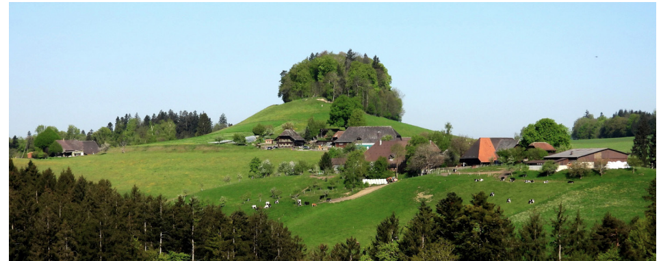
Friesenberg mit den Höfen Christen, Eberhart, Rentsch und Wegmüller