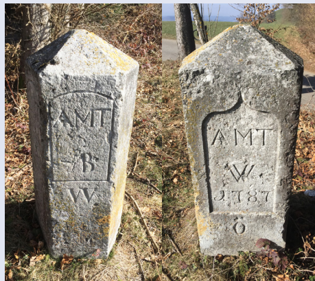
Zwei-Ämterstein Ferrenberg-Wald nordseitig: Amt B = Burgdorf, W = Wynigen südseitig: Amt W = Wangen 1787, Ö = Oeschenschbach (nach 1803 Amt Aarwangen)

Den Zwei-Ämterstein beim Ferrenbergwald liess man stehen. So ist geklärt, warum auf diesem Marchstein für Oeschenschbach noch die alte Zuteilung zum Amt Wangen steht.