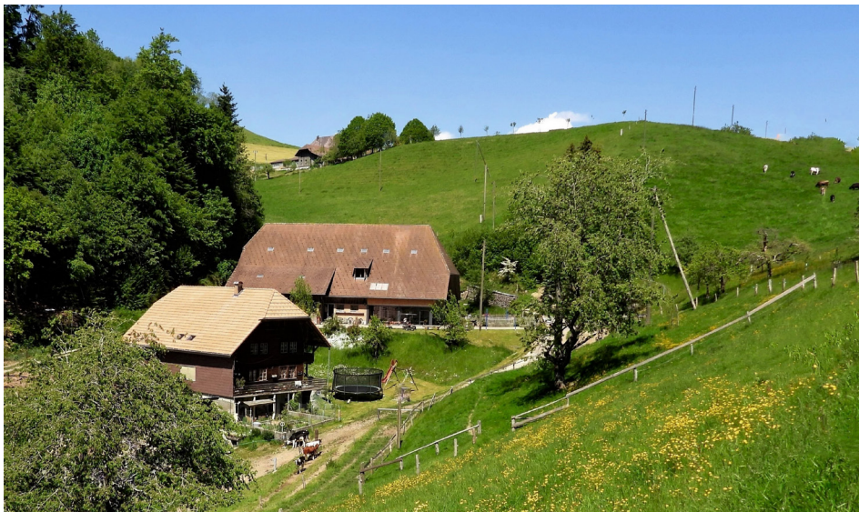
Kappelenstalden unterhalb Friesenberg