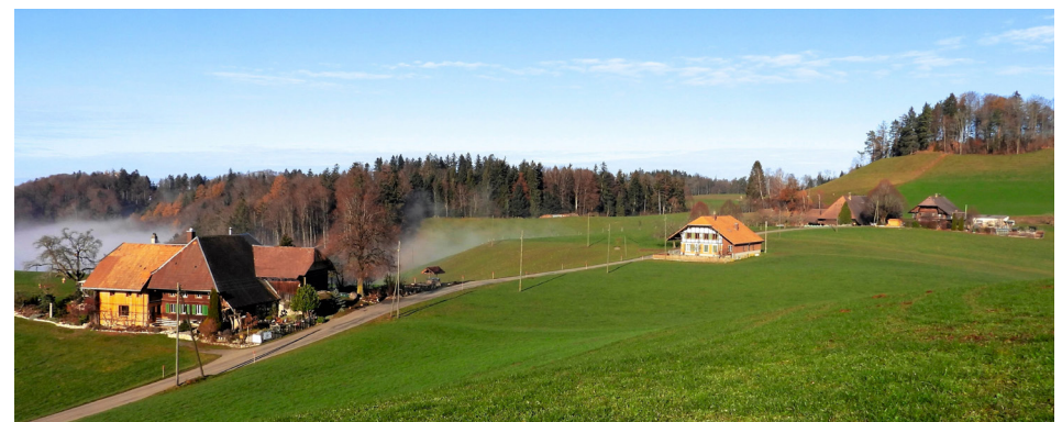
Käserhüsli mit Halle Garten, ehemalige Käserei, Hof Christen, Hof Adeli, Burghügel

mend weitere ihre Milch bis zur Gründung der Käsereigesellschaft Ferrenberg 1853 nach Friesenberg. Im Sommer 1847 produzierte die Käserei Friesenberg im Stöckli von Johann Ryser (heute Christen) aus der Milch von 20 Bauern 120 Käselaipe. 1911 war das neue Käsereigebäude an der Strasse nach Häckligen bezugsbereit. In die Käserei lieferten Bauern aus vier Gemeinden Milch : Friesenberg und Häckligen in der Gemeinde Wynigen, Friedihus – Seeberg, Chleiweidli – Oeschenschbach und Plunihus – Walterswil. Infolge der industriellen Milchverarbeitung Ende des 20. Jahrhunderts erlitt die Käserei Friesenberg das gleiche Schicksal wie die anderen Käsereien von Wynigen und wurde bis 2024 zur Milchsammelstelle.